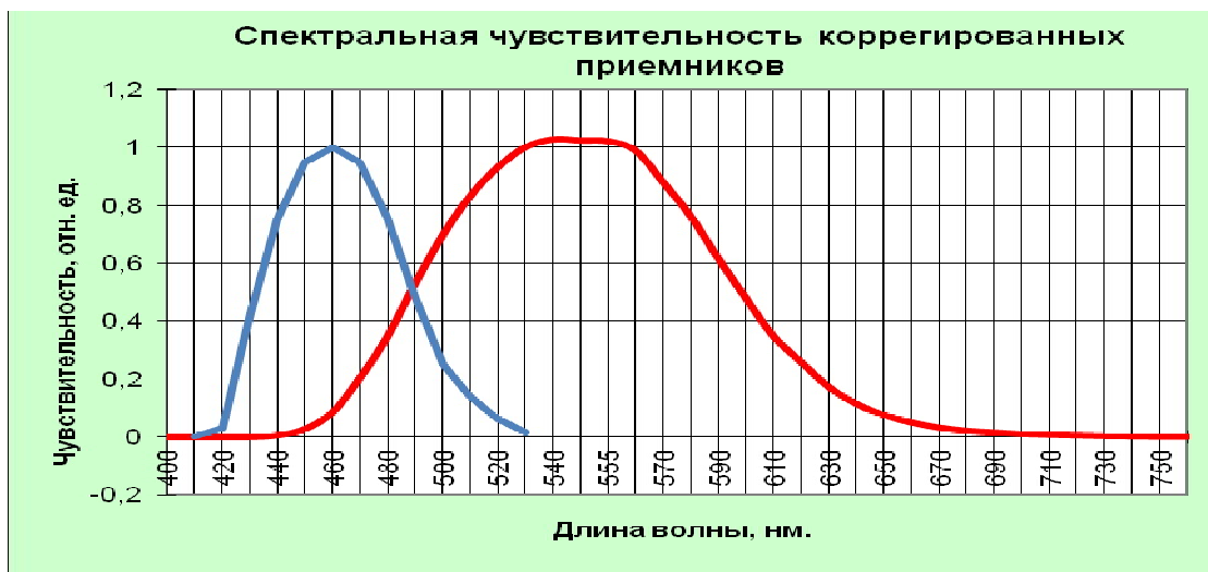
Рис. 4. Спектральная чувствительность "синего" и "красного" фотоприемников.

Авторами предложен упрощённый способ для оперативного измерения коррелированной цветовой температуры белых светодиодов, построенной на имперической зависимости реакции "синего" и "красного" фотоприемника на излучение фотодиодов от коррелированной цветовой температуры белых светодиодов.