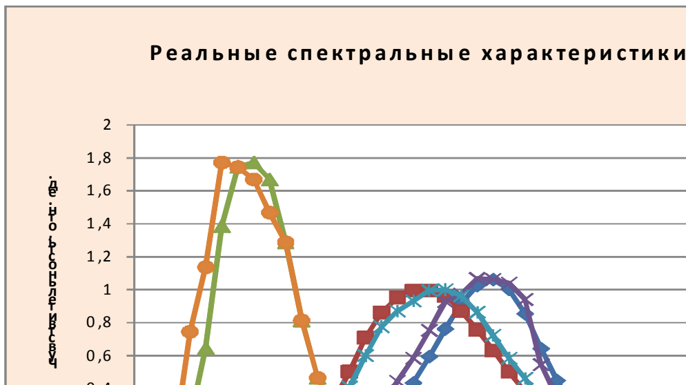
Рис. 2. Реальные спектральные характеристики скорректированных фотоприемников интегрального колориметра.

При реальных спектральных характеристиках фотоприемников координаты цветности определяются с определенной погрешностью. Погрешности \Delta(x, y) могут достигать величин \pm(0,02 - 0,03) . Следствием этого является ошибка при определении коррелированной цветовой температуры, которая может достигать значений \pm 500 К. Как правило, выполнить идеальную коррекцию спектральной чувствительности фотоприемников к заданному виду с помощью набора существующих цветных стекол практически невозможно. На рис. 2. показаны реальные спектральные характеристики скорректированных фотоприемников колориметра.